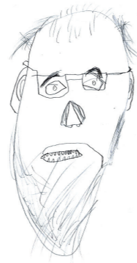
joonistasid 2. klassi õpilased