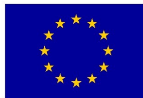
Euroopa Liit Euroopa Sotsiaalfond