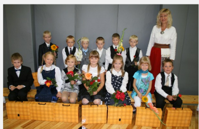
Fotol 1. klass esimesel koolipäeval