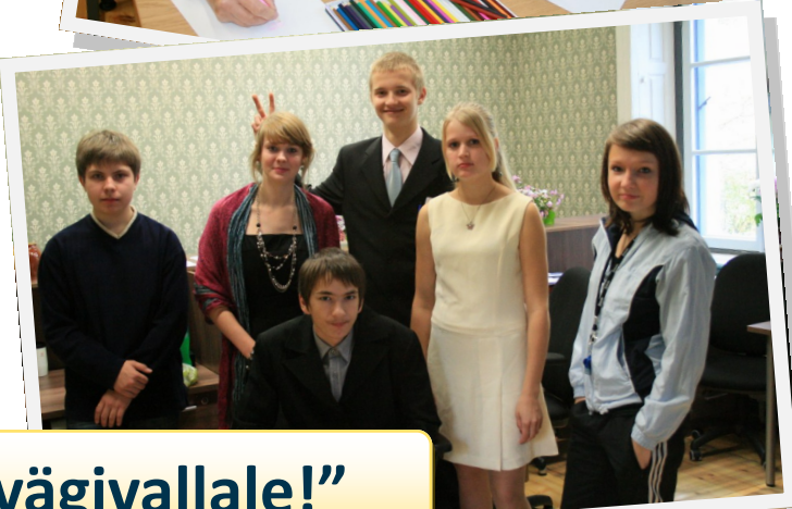
Fotol uued "õpetajad"